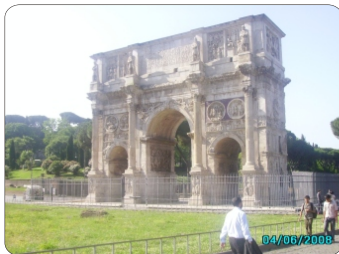
L'Arc de triomphe, symbole de la ville et du passé glorieux des Romains

Son Excellence Monsieur le Deuxième a remercié le maire de la ville de Milan pour toutes ces initiatives en faveur de l'Afrique en général et du Burundi en particulier. Il a fait remarquer que le Burundi souhaitait que la ville de Milan appuie les efforts d'augmentation de la production agricole en encourageant le transfert des technologies et la vulgarisation de l'irrigation des champs. Il a salué le projet de s'occuper de la santé des enfants en faisant remarquer que le Burundi a décidé de soigner gratuitement les enfants de moins de cinq