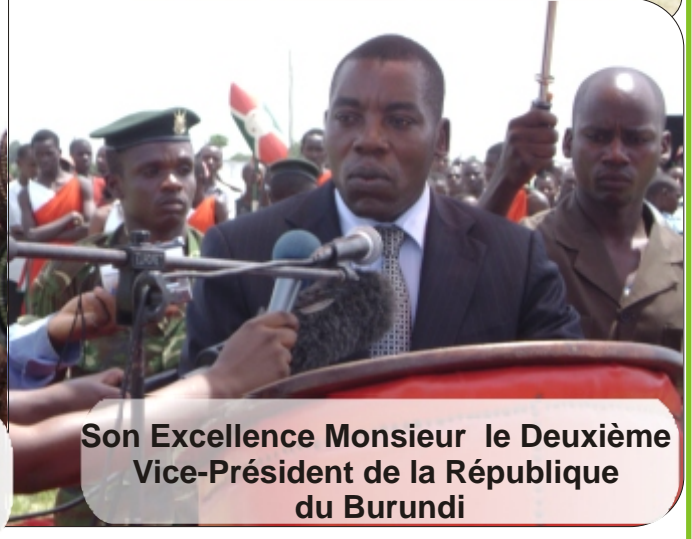
Son Excellence Monsieur le Deuxième Vice-Président de la République du Burundi