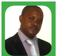
Rénovat Nimbona @nimbonarenovat

Il sied de signaler que l'ISPG qui a commencé avec 150 étudiants compte aujourd'hui 1300 étudiants avec quatre filières de formation à savoir les Soins Infirmiers, Sages Femmes, Santé Publique et Développement Communautaire. A part les ressortissants burundais, Institut comptent également à son sein des étudiants en provenance de la République Démocratique du Congo.