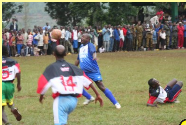
Nkurunziza en pleine action