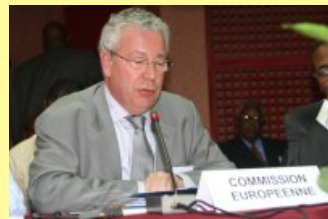
Conférence des partenaires