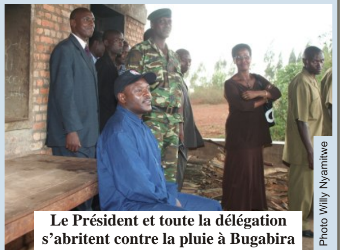
Le Président et toute la délégation s'abritent contre la pluie à Bugabira