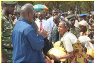
Au secours de Bugabira