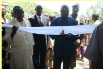
Nkurunziza porteur de deux bonnes nouvelles