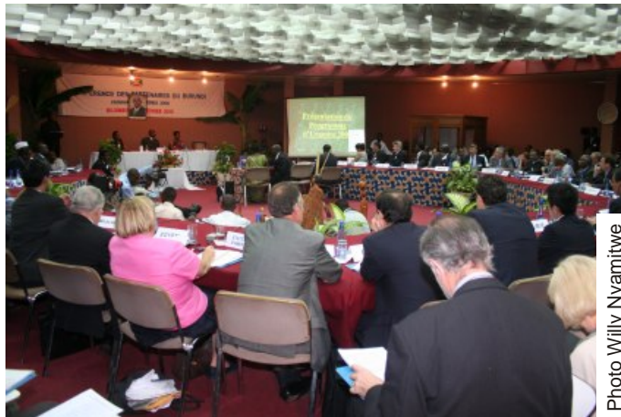
Vue d'ensemble des participants

Au cours de la séance d'ouverture, la Conférence a pris note des messages respectifs du Ministre des Relations Extérieures et de la Coopération Internationale, de l'Ambassadeur de la République Populaire de Chine, en sa qualité de Doyen du Corps diplomatique et consulaire, du Secrétaire Général des Nations Unies, du Vice-Président de la République Fédérale du Nigeria, et du Président de la République du Burundi.