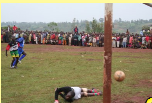
Nkurunziza tire avec force et marque