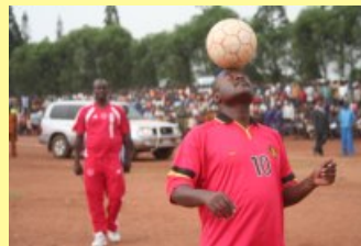
L'Equipe du Président remporte deux victoires à Kirundo