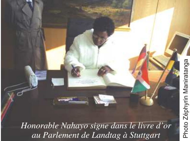
Honorable Nahayo signe dans le livre d'or au Parlement de Landtag à Stuttgart