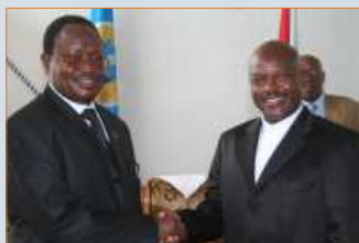
Présentation de Lettres de Créances