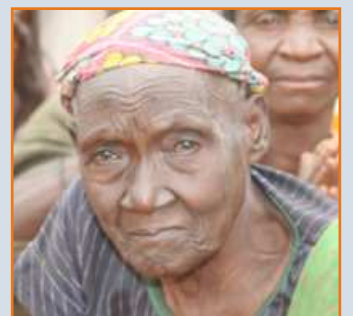
Aide alimentaire à Cankuzo et Ruyigi