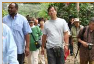
Enfin : Les Touristes !