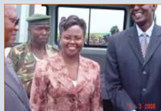
Pause de la première pierre de Olypafrica